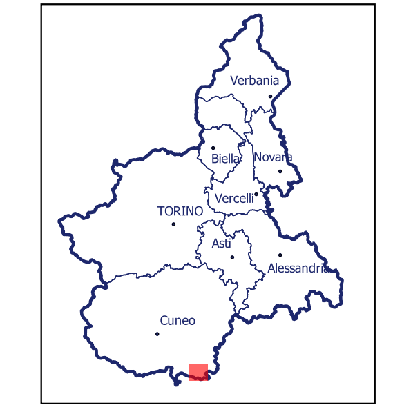
Localizzazione dell'area di studio nell'ambito regionale