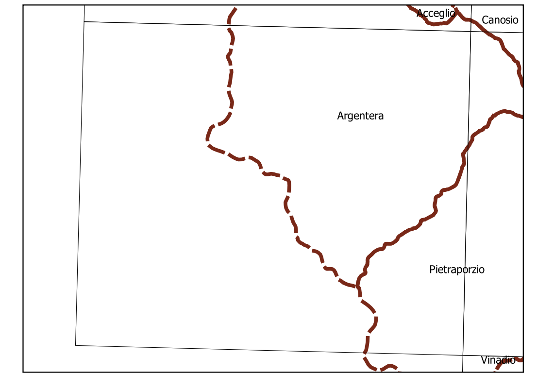
Inquadramento secondo la Carta Tecnica Regionale: Tavola 224 NE