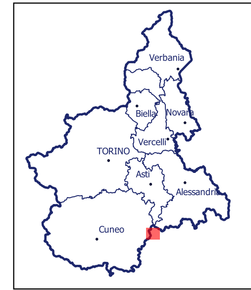
Localizzazione dell'area di studio nell'ambito regionale