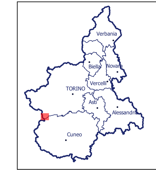
Localizzazione dell'area di studio nell'ambito regionale