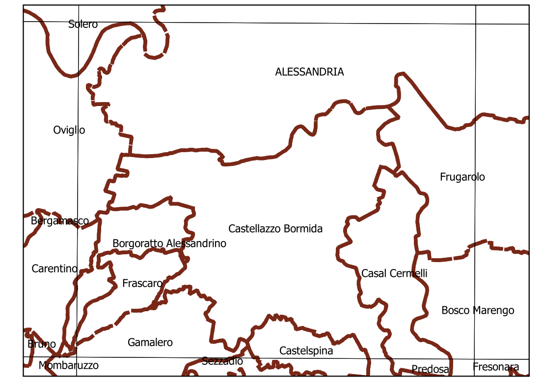
Inquadramento secondo la Carta Tecnica Regionale: Tavola 176 SE