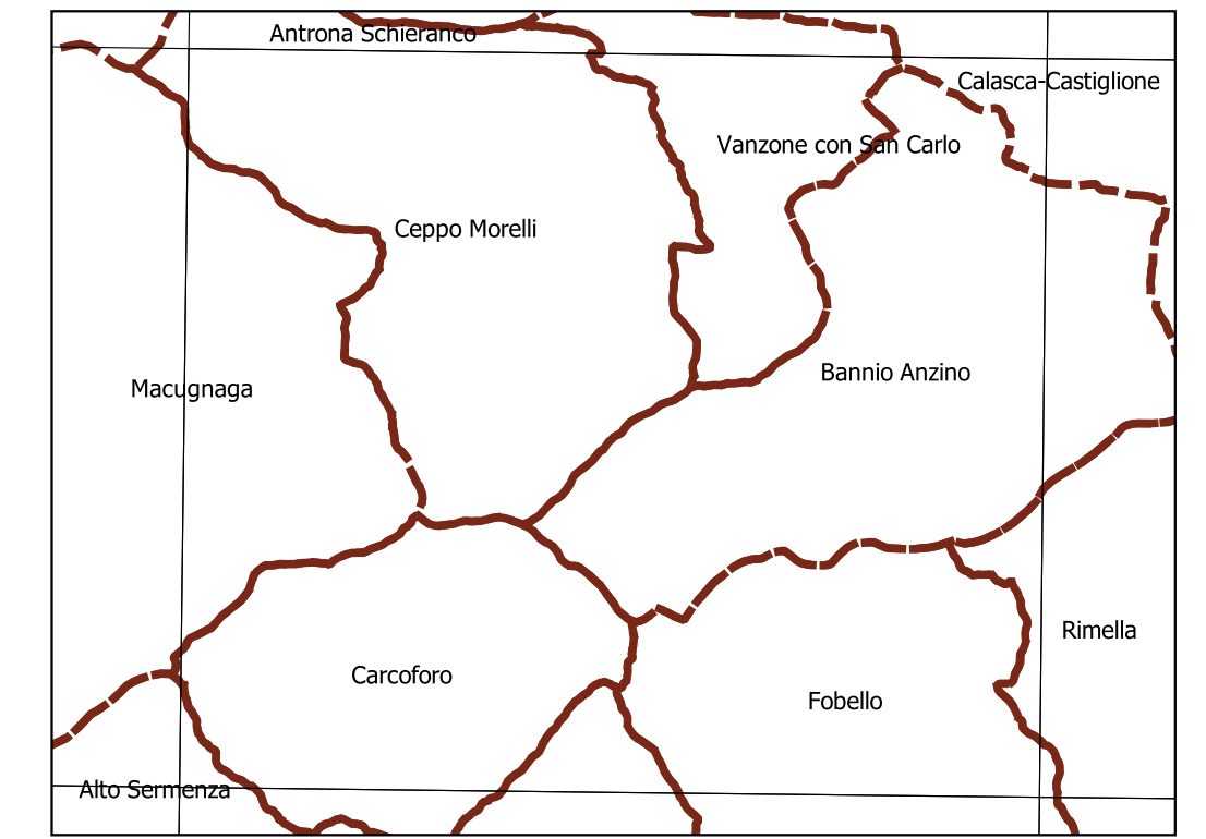
Inquadramento secondo la Carta Tecnica Regionale: Tavola 072 NW