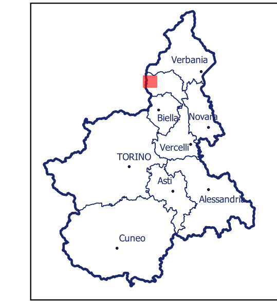
Localizzazione dell'area di studio nell'ambito regionale