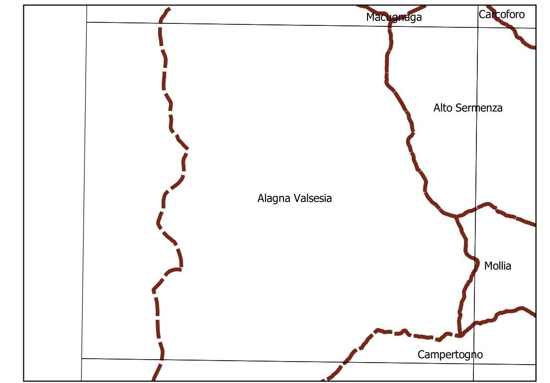
Inquadramento secondo la Carta Tecnica Regionale: Tavola 071 SE