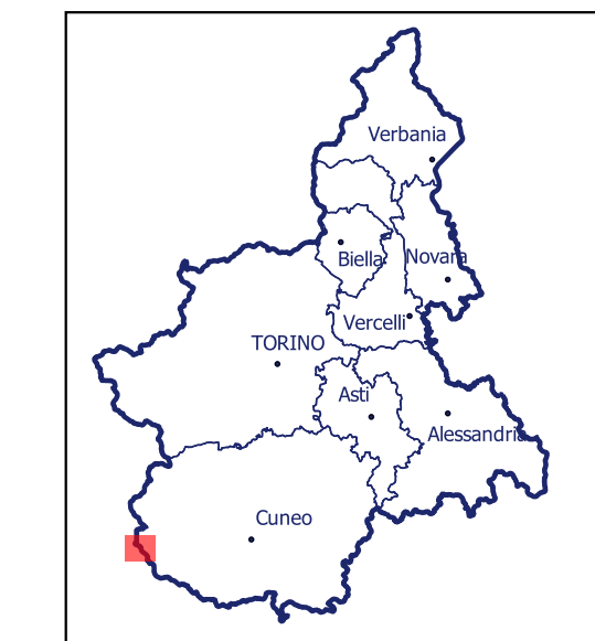
Localizzazione dell'area di studio nell'ambito regionale