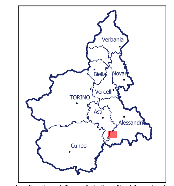
Localizzazione dell'area di studio nell'ambito regionale