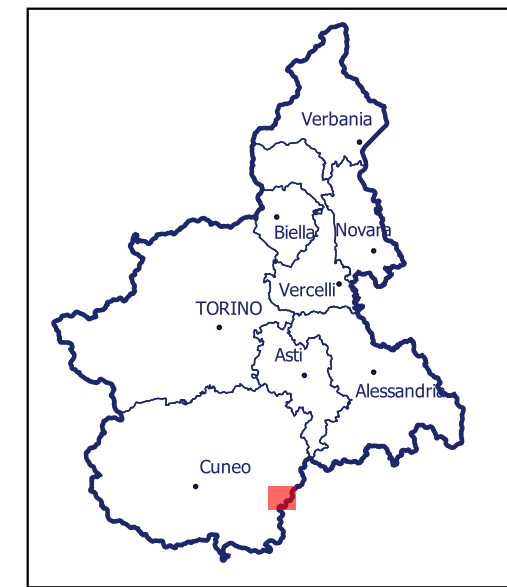
Localizzazione dell'area di studio nell'ambito regionale