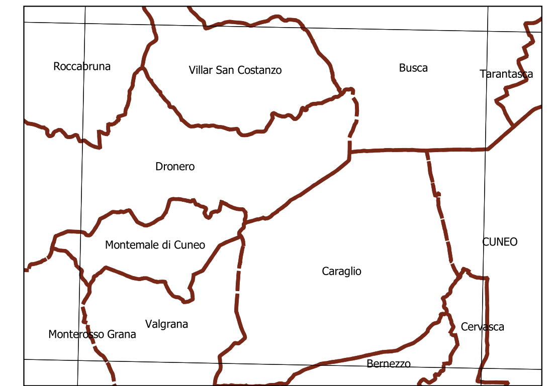
Inquadramento secondo la Carta Tecnica Regionale: Tavola 209 SW