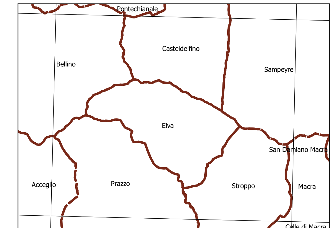
Inquadramento secondo la Carta Tecnica Regionale: Tavola 208 NW