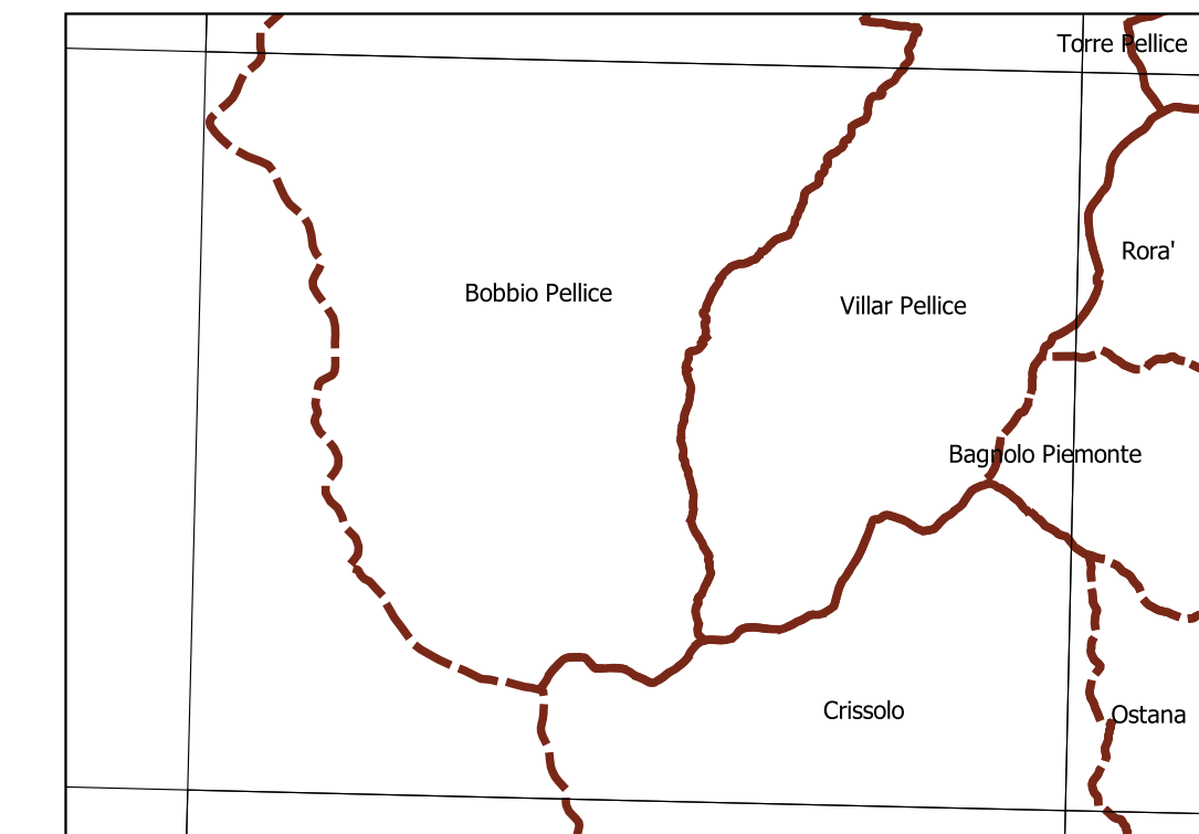
Inquadramento secondo la Carta Tecnica Regionale: Tavola 190 NW