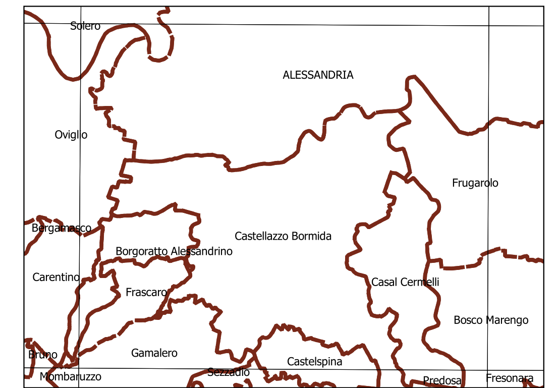
Inquadramento secondo la Carta Tecnica Regionale: Tavola 176 SE