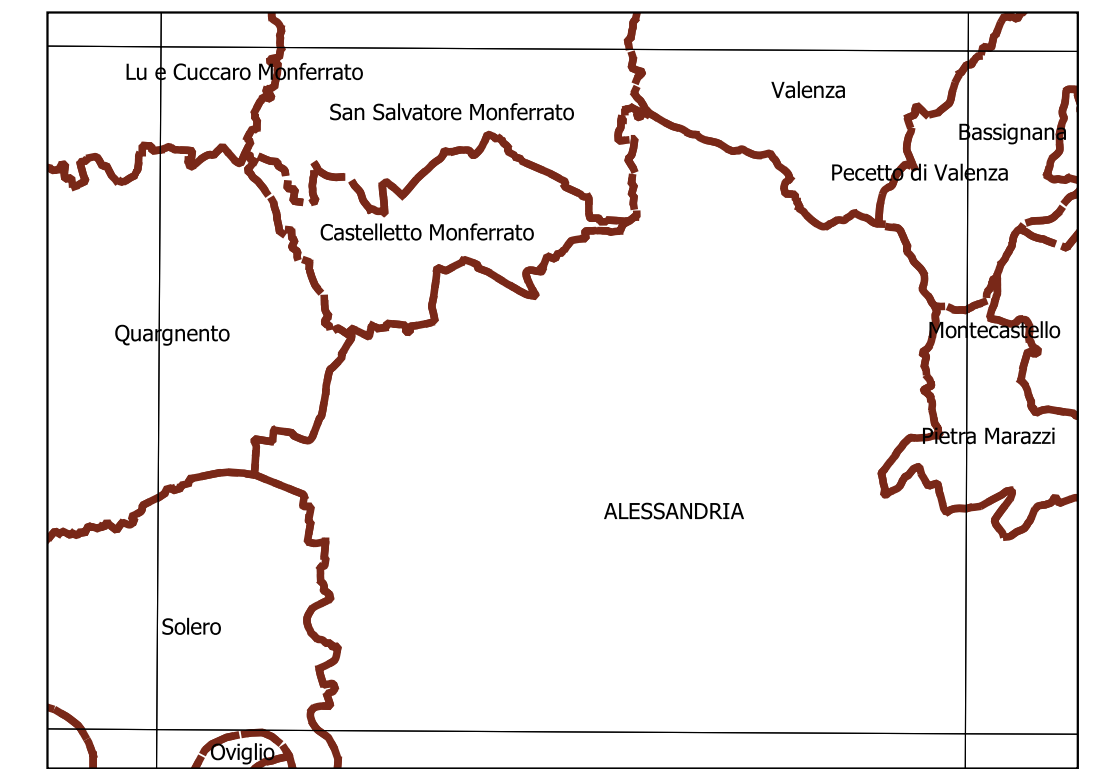
Inquadramento secondo la Carta Tecnica Regionale: Tavola 176 NE