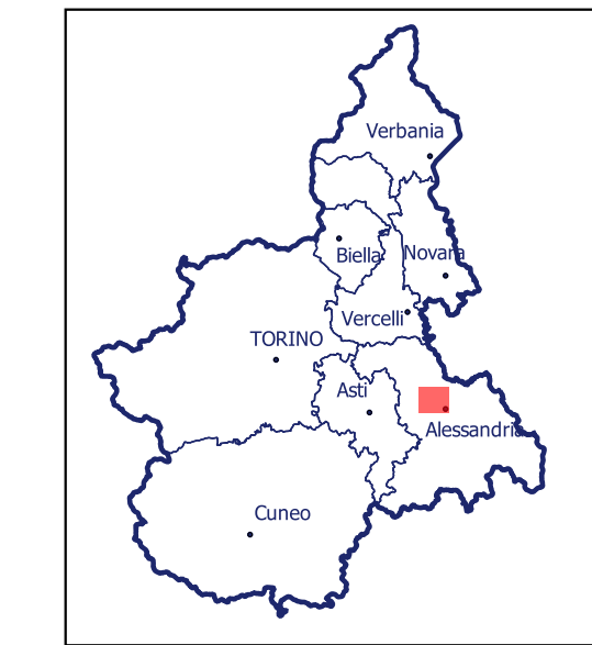
Localizzazione dell'area di studio nell'ambito regionale