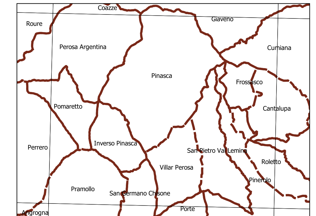
Inquadramento secondo la Carta Tecnica Regionale: Tavola 172 NE