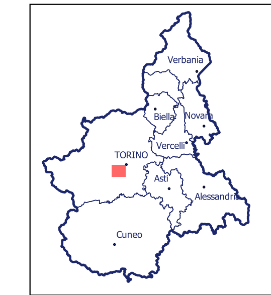
Localizzazione dell'area di studio nell'ambito regionale