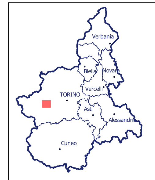
Localizzazione dell'area di studio nell'ambito regionale