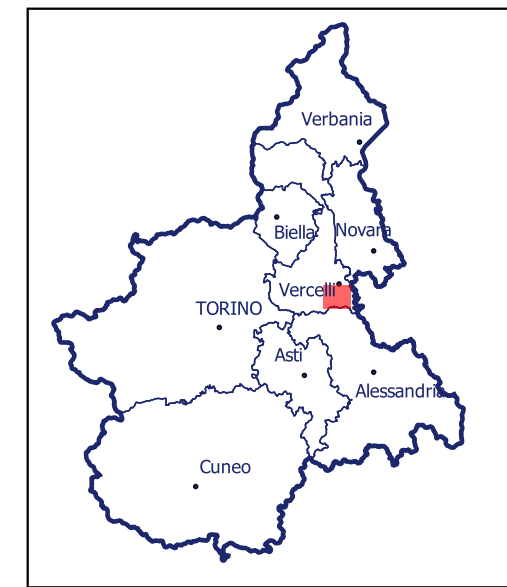
Localizzazione dell'area di studio nell'ambito regionale