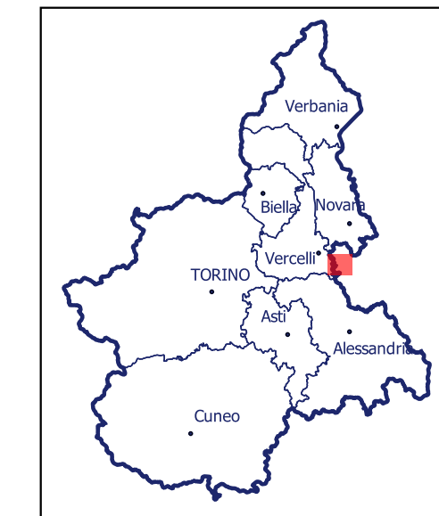
Localizzazione dell'area di studio nell'ambito regionale