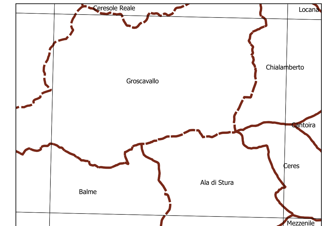
Inquadramento secondo la Carta Tecnica Regionale: Tavola 133 NE