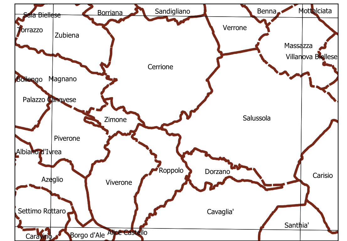
Inquadramento secondo la Carta Tecnica Regionale: Tavola 115 SW