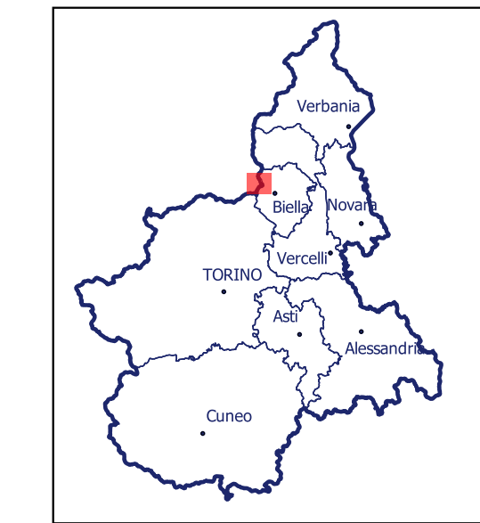
Localizzazione dell'area di studio nell'ambito regionale