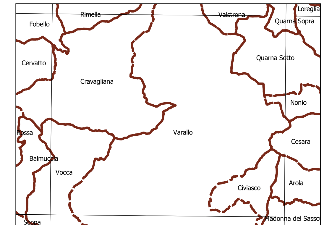
Inquadramento secondo la Carta Tecnica Regionale: Tavola 072 SE