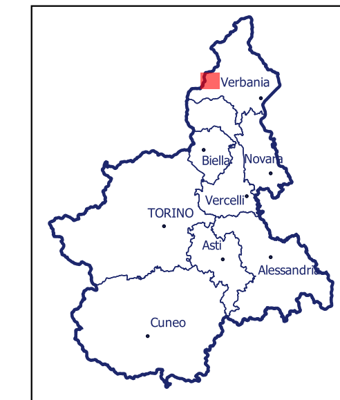
Localizzazione dell'area di studio nell'ambito regionale