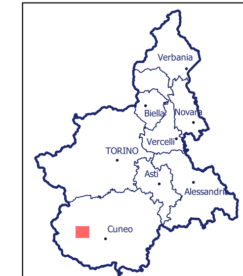
Localizzazione dell'area di studio nell'ambito regionale