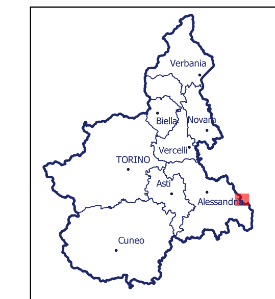
Localizzazione dell'area di studio nell'ambito regionale