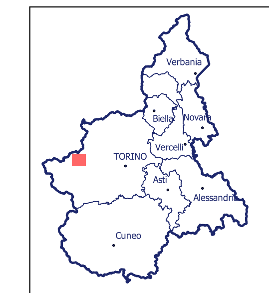
Localizzazione dell'area di studio nell'ambito regionale