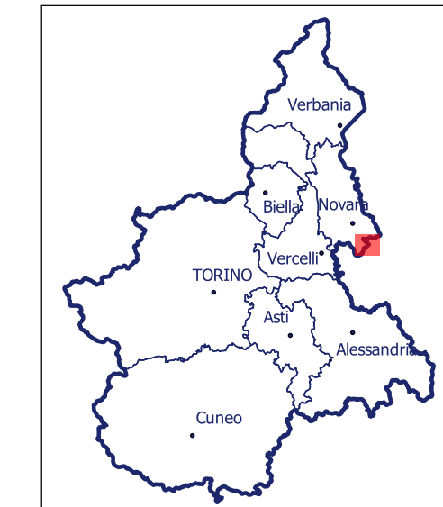
Localizzazione dell'area di studio nell'ambito regionale