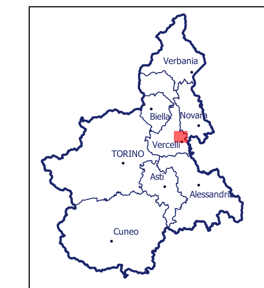
Localizzazione dell'area di studio nell'ambito regionale