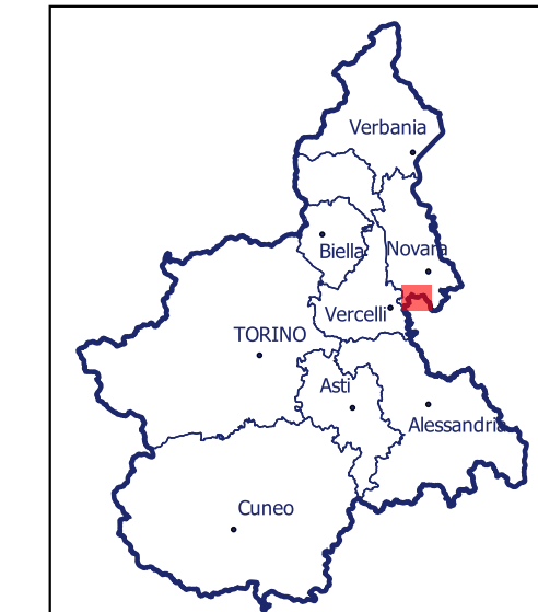
Localizzazione dell'area di studio nell'ambito regionale